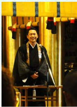
本山 御影堂にて (副住職)

「まんまん茶房」 昨年の8月20日から24日の4日間、京都・本願寺の常例布教に出講させていただきました。晨朝勤行(おあさじ)での御堂法話は、緊張の中にも尊い仏縁でした。ご門主様(本願寺ご住職)ご出座のもと、余りにも緊張に、行ったこともない宇宙とは、こういうフワフワした感覚なのか?という経験をさせていただきました。この任の終わりに際し、ホッとした安堵感の中で、ご真影様(親鸞聖人ご木像)の前に額ずいたとき、親鸞聖人様から『さあ、これからこれから。』とのお声が響いてまいりました。あらためて、僧侶としての研鑽の歩みとともに、阿弥陀さま、親鸞聖人様、お支え下さるすべてのの方々にお礼を申さずにはおれない仏縁でありました。